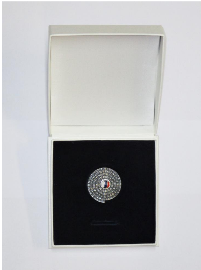
Visoko državno odlikovanje častni znak svobode Republike Slovenije teritorialca Stanislava Zlobka.